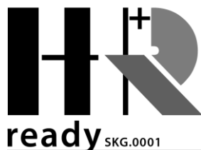
Figuur 2: Merkteken HR + -Ready zonwering