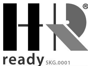
Figuur 1: Merkteken HR-Ready zonwering

Producten die geleverd worden onder een SKG HR-ready verklaring dienen dusdanig geïdentificeerd te zijn dat zichtbaar is dat de producten onder een SKG HR-Ready verklaring vallen. Daartoe dient het product voorzien te zijn van het merkteken voor HR-Ready zonwering of HR + -Ready zonwering. Als alternatief is het tevens toegestaan om dit op begeleidende documenten aan te geven. In onderstaande afbeeldingen is weergegeven welk merkteken daarvoor gebruikt dient te worden.